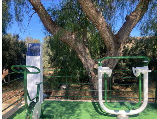
Placa colocada en Gádor