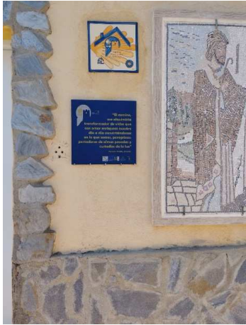
Placa colocada en Rioja