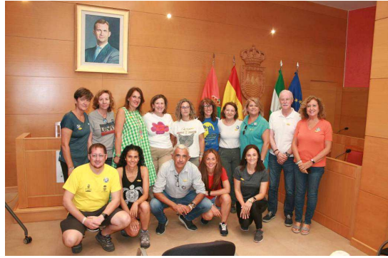
Equipos técnicos del GDR Coordinador del Proyecto, Sierra Morena Cordobesa, Sierra Nevada Alpujarra Almeriense y Filabres Alhamilla. Presidentes de los dos GDR,s de Almería y alcaldes de Gádor y Santa Fe de Mondújar.

A las 10:30 hubo una pausa café donde los participantes interactuaron e intercambiaron opiniones y conocimientos sobre el Camino Mozárabe y acto seguido comenzó la etapa del Camino Mozárabe de Santiago entre Gádor y Santa Fe de Mondújar, realizando el tramo de camino a pie, interpretándose en el mismo los principales hitos de dicho tramo.