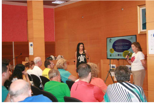
Presentación de resultados en Gádor a cargo de las gerencias de ambos GDR

Tras la presentación se emitió el video promocional del Camino Mozárabe en la provincia de Almería y el de los municipios del ámbito de actuación del GDR Filabres Alhamilla, es decir el del municipio de Rioja y de Gádor.